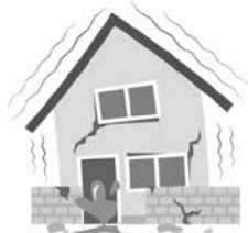
地震による液状化で建物が沈下した

注1：団体扱分割払（月払）契約の場合、一般分割払契約に比べ「分割割増（5%）なし」となります。また当団体においては上記適用後の金額に大口団体割引5%が適用されます。