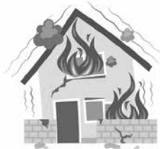
地震で火災が発生し家が焼失した