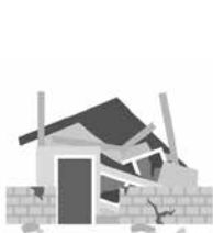
地震で家が倒壊した