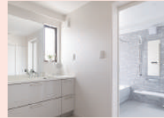
洗面・脱衣所のヒートショック対策

ミサワリフォームでは診断結果に基づき、お住まいの状況にあわせたリフォーム計画をご提案します。