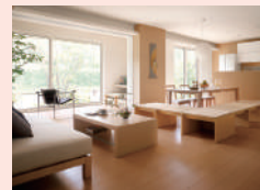
開口部の断熱対策をチェック